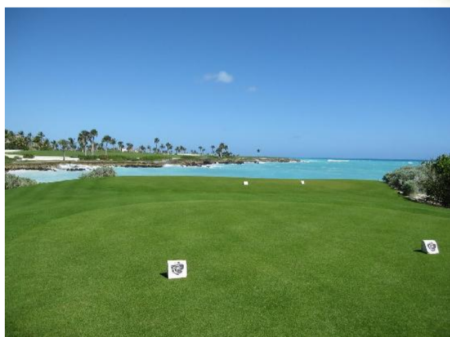
tees de saída