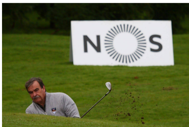
pop up no fairway