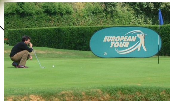
pop up no green