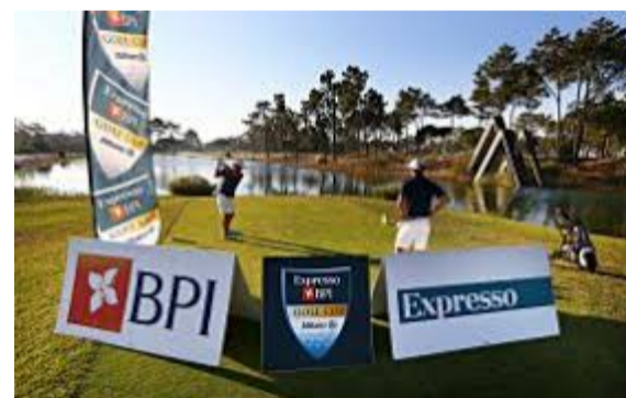
pop up e bandeira no tee de saída