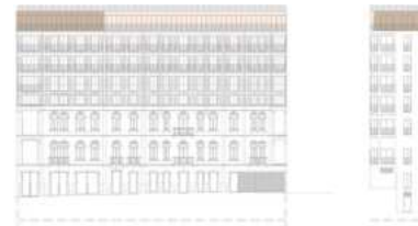
FACHADA PRINCIPAL MAIN FACADE