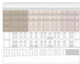
FACHADA PRINCIPAL MAIN FACADE