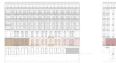
FACHADA PRINCIPAL MAIN FACADE